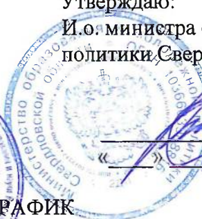
ГРАФИК 15-дневного заезда отдыхающих в ГАУ СО «Профилакторий «Юбилейный» на 2025 год